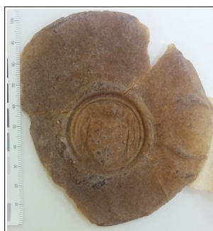
Sceau recto avant traitement Sceau verso avant traitement