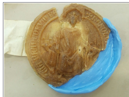
Silicone (base du comblage)

Regarde ce film tourné aux Archives départementales sur la méthode de restauration de sceaux d'Andrea (vidéo sur le site https://archives.somme.fr )