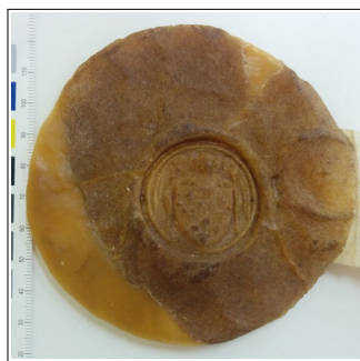
Sceau recto après traitement Sceau verso après traitement