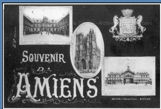
Souvenirs d'Amiens, avec les armoiries de la ville, 8FI2323