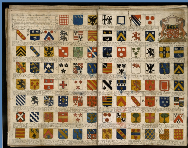
Nobiliaire de Picardie, ADS, 1FI1654