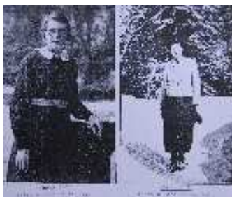
Archives départementales de la Somme, Fonds Yolande Labarre - 97 J 21 et 97 J 29