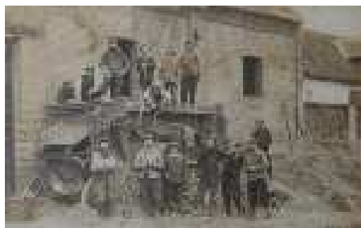
Archives départementales de la Somme, Fonds Yolande Labarre - 97 J 9