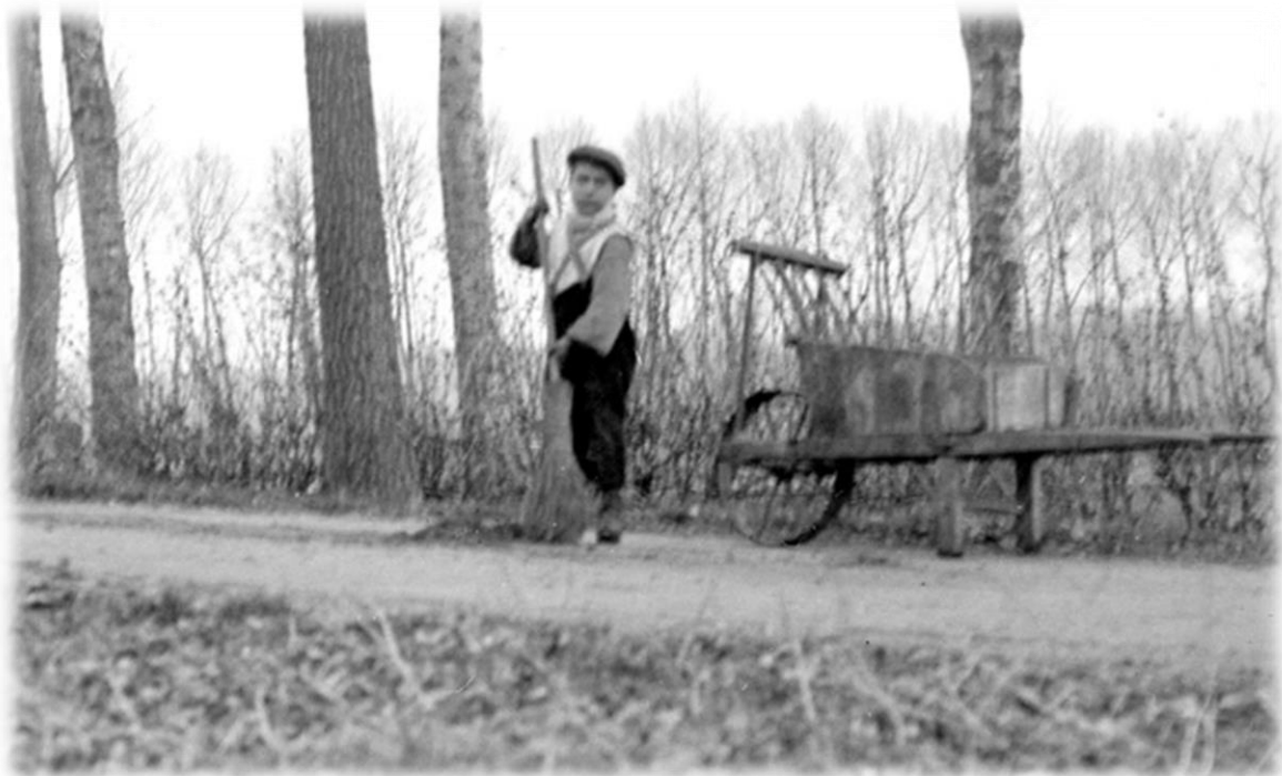
Le ramassage du crottin, photographie, v.1900-1910

SERVICE ÉDUCATIF ARCHIVES DÉPARTEMENTALES DE LA SOMME