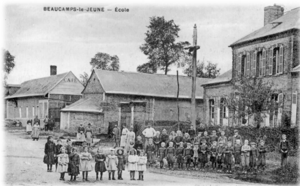
Ecole de Beaucamps-le-Jeune, carte postale, 1918 [AD80 : 8F12689]