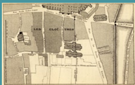
Plan du quartier canonial de la ville d'Amiens, extrait de l'Histoire de la ville d'Amiens par Albéric de Calonne, tome 1, planche 5. A.D. Somme, 8°243/1.