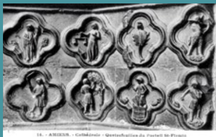
Carte postale représentant les quadrilobes sculptés ornant le portail Saint-Firmin sur la façade occidentale de la cathédrale d'Amiens. A.D. Somme, 8 FI 485.