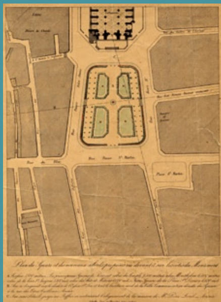
Plan du square et des nouveaux abords proposés au devant et sur les côtés de la cathédrale d'Amiens, vers 1865. Archives de la Somme, 1 FI 49.