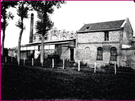
Vue extérieure d'une usine, 1900-1913