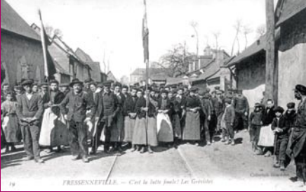
Vue d'une manifestation d'ouvriers lors des grèves de 1906